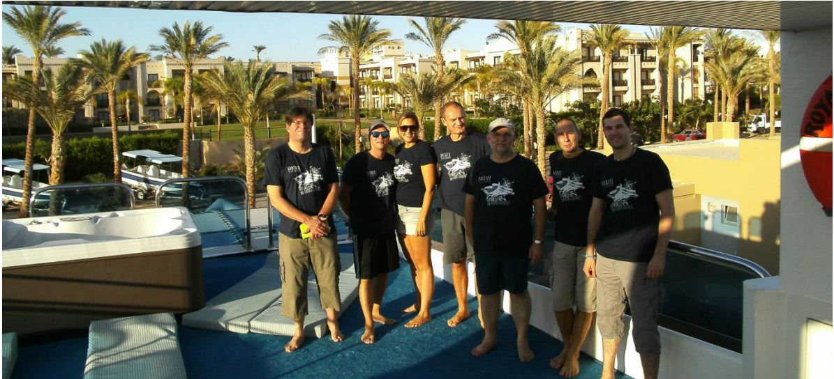
Die Tauchgruppe des TSC Viernheim und das Safariboot die „My Royal Evolution“.