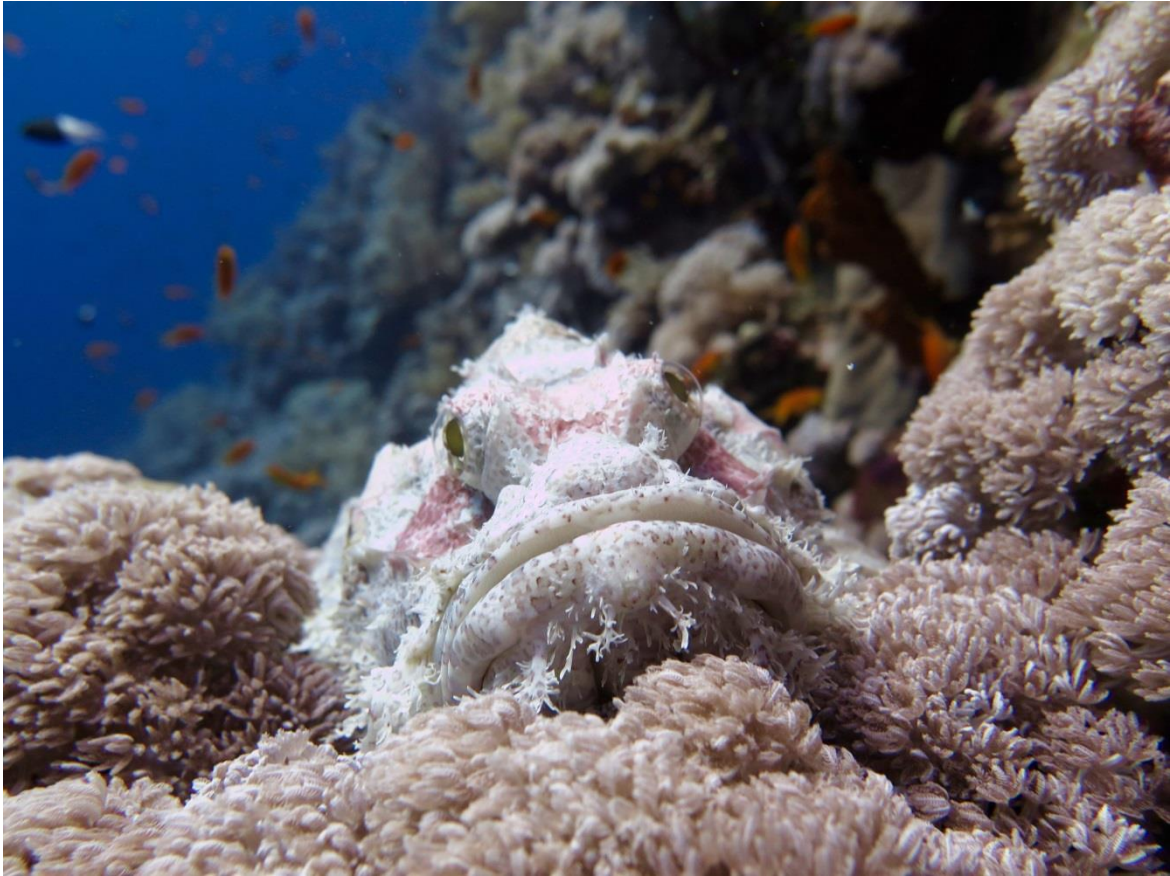
Oben: Ein Skorpionfisch im Korallenriff. Unten: Ein Weißspitzen-Hochseehai.