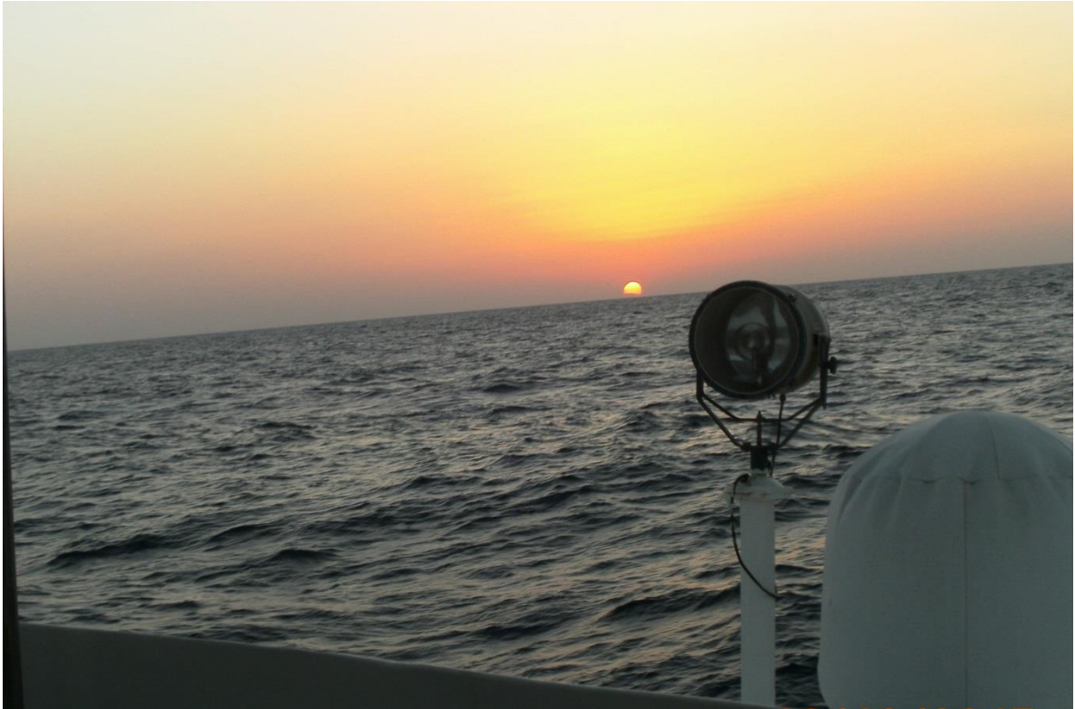
Ein Sonnenaufgang über dem Roten Meer und das „Big Brother“ Riff mit weiteren Safaribooten.