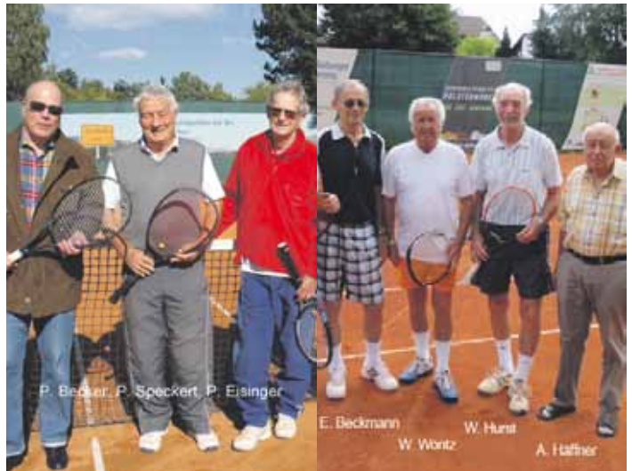
Herren 70: siehe Bild Auf den Bildern fehlt: Jürgen Schmutzer