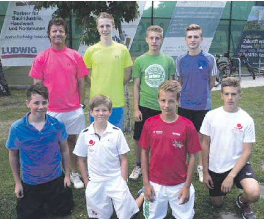
Gruppenfoto der Teilnehmer der diesjährigen Jugend-Clubmeisterschaften U14 und U16