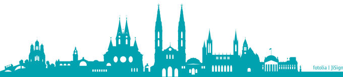
foto11a | JSign

Unterstützen Sie Bürgerengagement in Wiesbaden