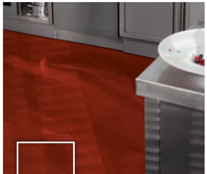
Jede Fläche mit ganz eigenem Charakter