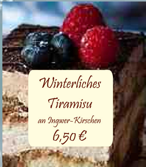
Winterliches Tiramisu an Ingwer-Kirschen 6,50 €