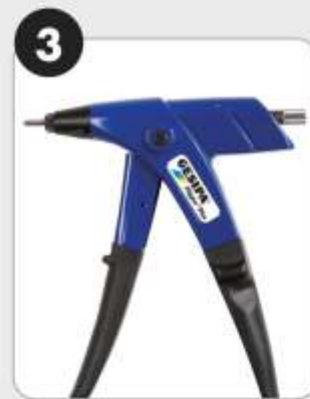
3. Umgerüstet Umgerüstet als Blindniet- muttern-Setzgerät