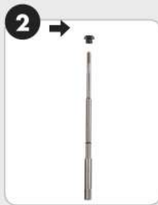
2. Der Einbau Einbau Gewindedorn und Mundstück