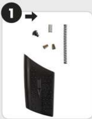
1. Der Ausbau Ausbau der im Bild dargestellten Teile

SCHNELLER UMBAU: MIT WENIGEN HANDGRIFFEN IN UNTER 1 MINUTE UMGERÜSTET