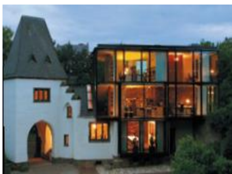
Sanieren und Renovieren