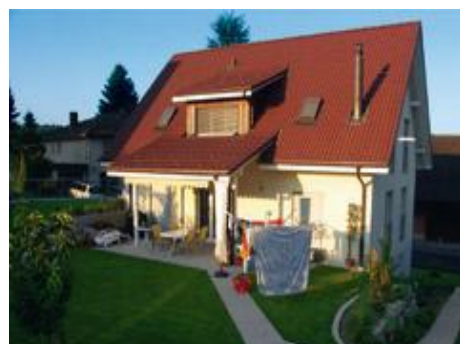
Sicheres Zuhause für die Familie