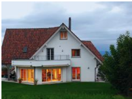
Lebensräume die mitwachsen