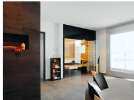
Komfort und Behaglichkeit