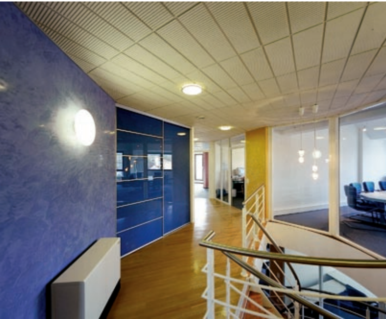
Ein schönes Treppenhaus lässt auf einen freundlichen Empfang hoffen...