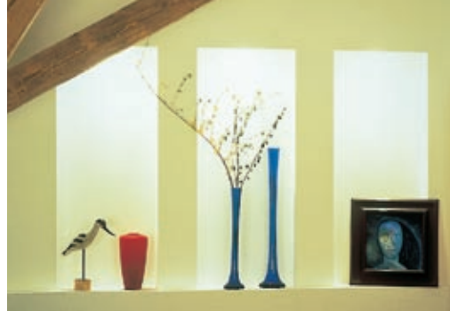
Nischen als Blickfang.