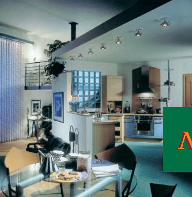
Gemütlichkeit durch gekonnte Raumgliederung.