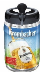
KB Frischefass 5L 13,50