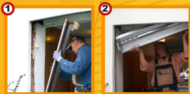
1. Altes Fenster oder Tür mit Rolladen wird demontiert.