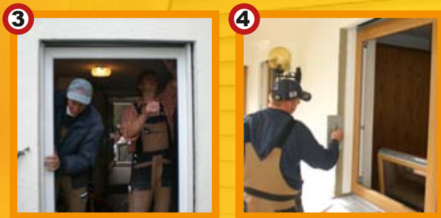
3. Das neue Fenster bzw. die neue Tür wird montiert.