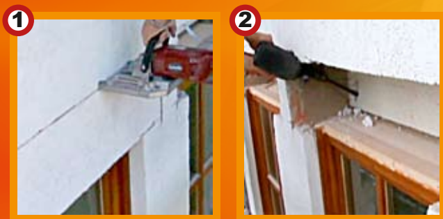
1. Einschneiden und Demontage der Aussenschürze