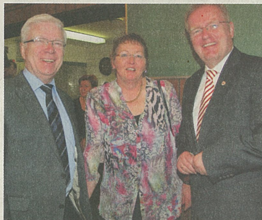
Auch die Porzer Karnevalisten sind gerne gesehene Gäste beim Neujahrsempfang der Handwerksmeister Porz.

Seiner Meinung fließen unverhältnismäßig viele Steuergelder in den „Aufbau Ost“, während in den alten Bundesländern dringend benötigte Investitionen in die Infrastruktur auf der Strecke bleiben. Die Sperrung der Leverkusener Autobahnbrücke sei ein typisches Bei-